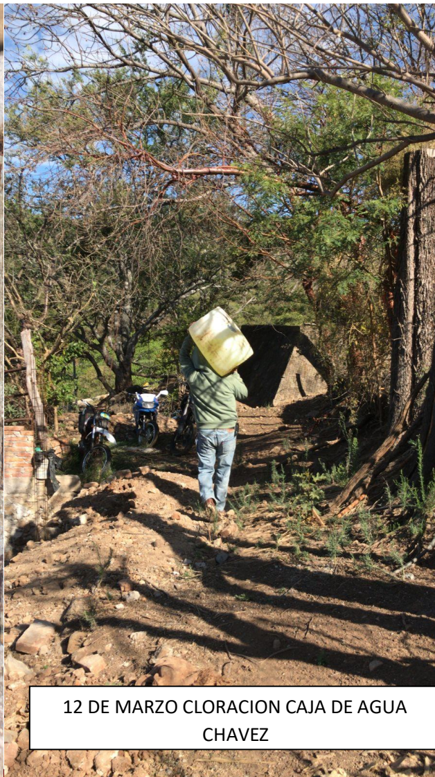
12 DE MARZO CLORACION CAJA DE AGUA CHAVEZ