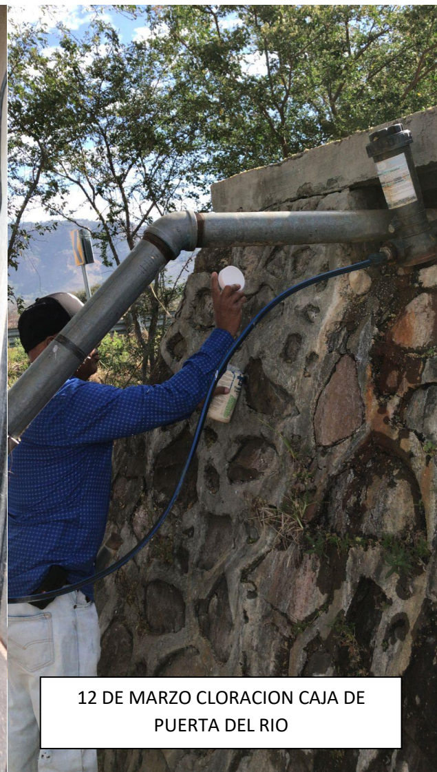
12 DE MARZO CLORACION CAJA DE PUERTA DEL RIO