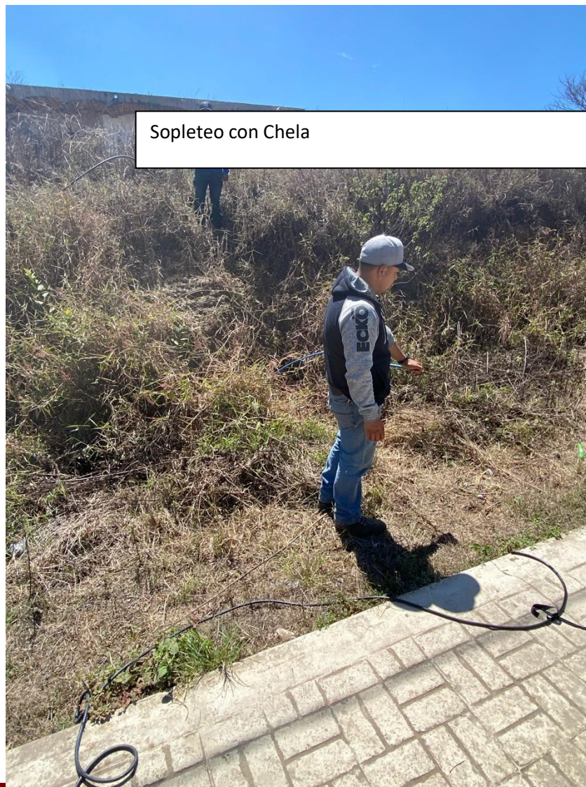
Sopleteo con Chela

DE 24 Carrill RTO PROLETARIADO, O Y DEFENSOR AYAB