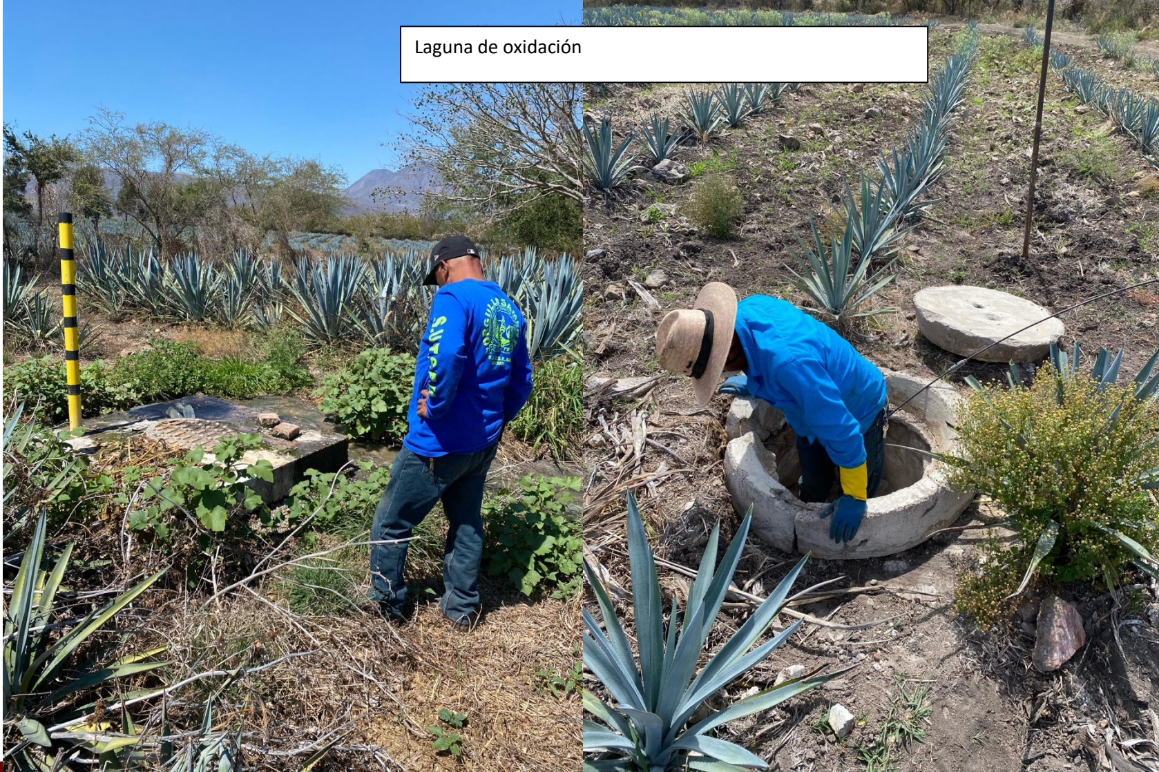
Laguna de oxidación

AÑO DE 2024 Carrill ERTO O DEL PROLETARIADO, ONARIO Y DEFENSOR DEL MAYAB