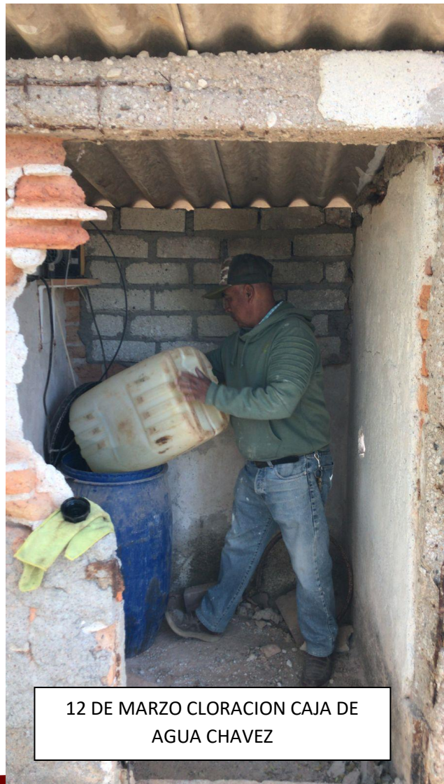
12 DE MARZO CLORACION CAJA DE AGUA CHAVEZ