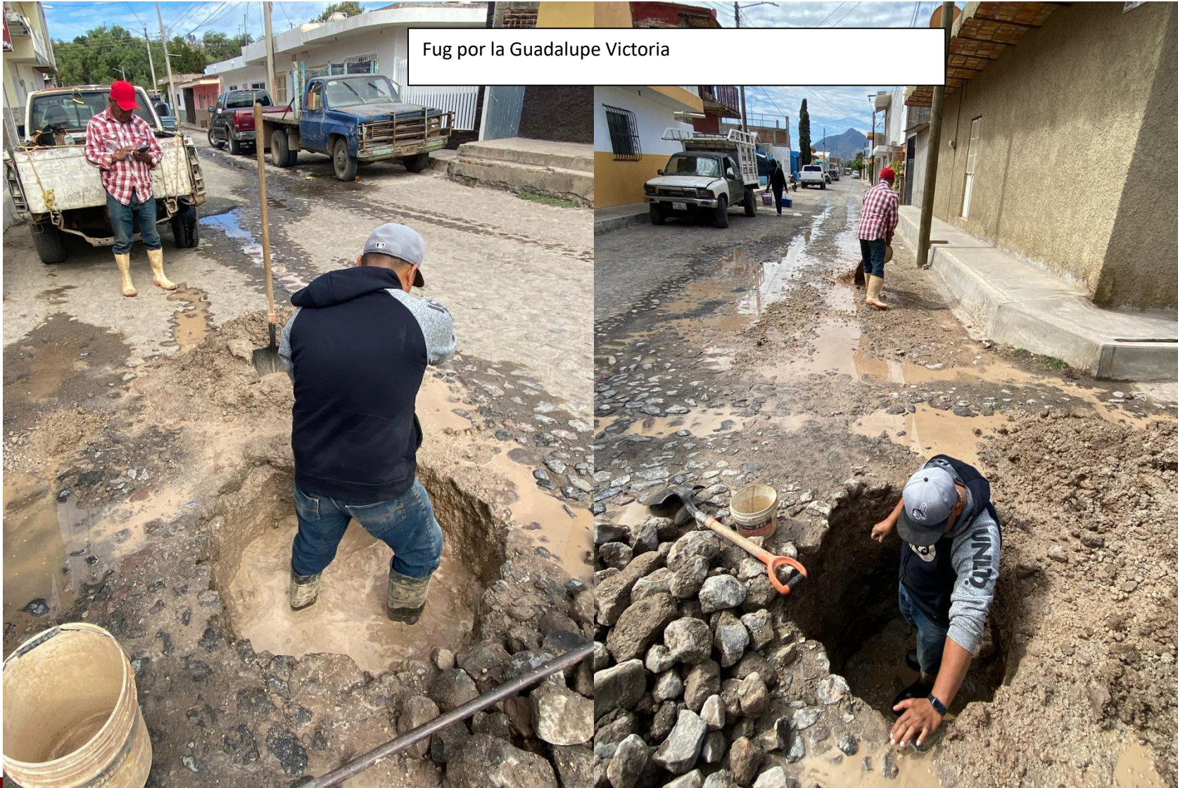
Fug por la Guadalupe Victoria