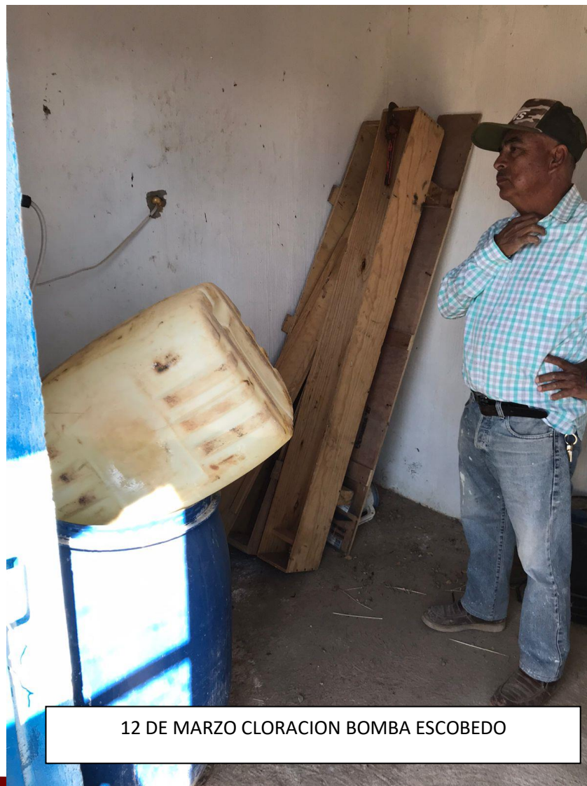
12 DE MARZO CLORACION BOMBA ESCOBEDO