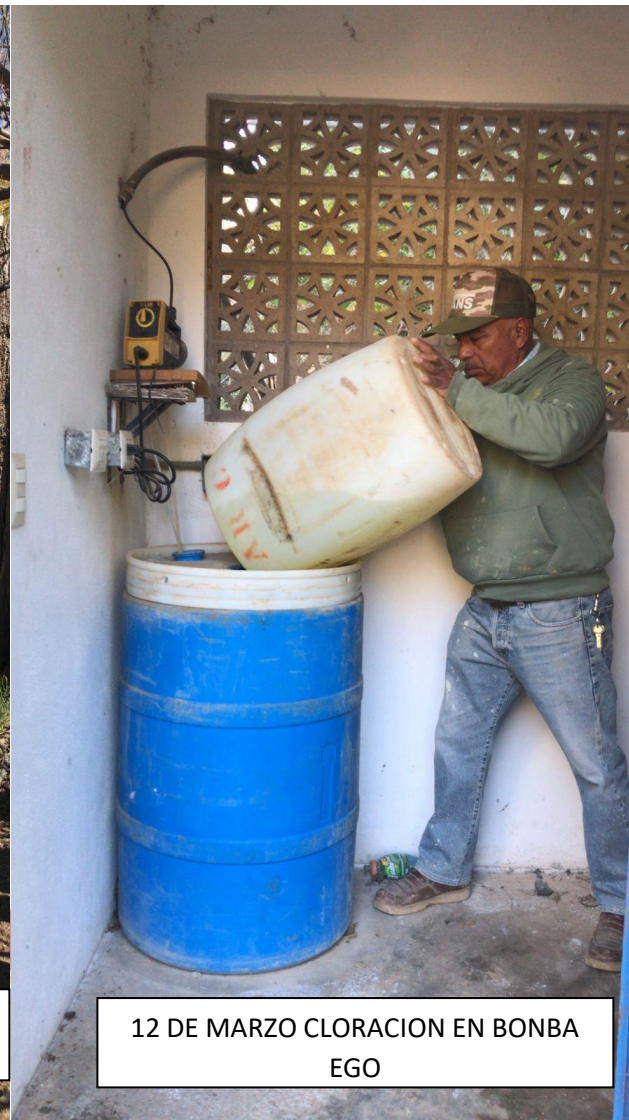
12 DE MARZO CLORACION EN BONBA EGO