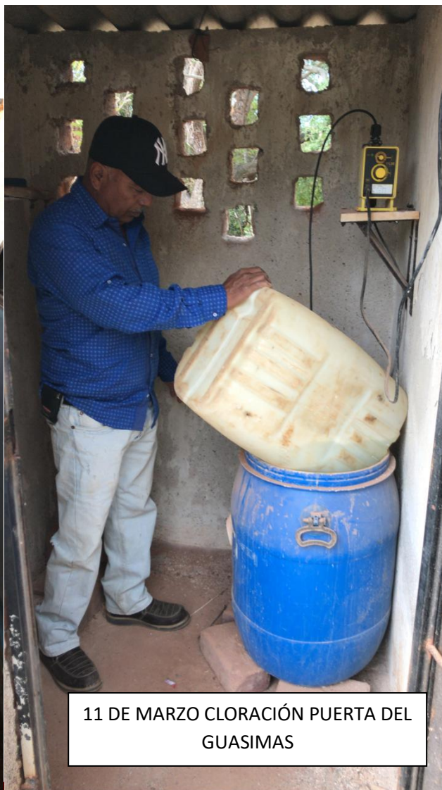
11 DE MARZO CLORACIÓN PUERTA DEL GUASIMAS