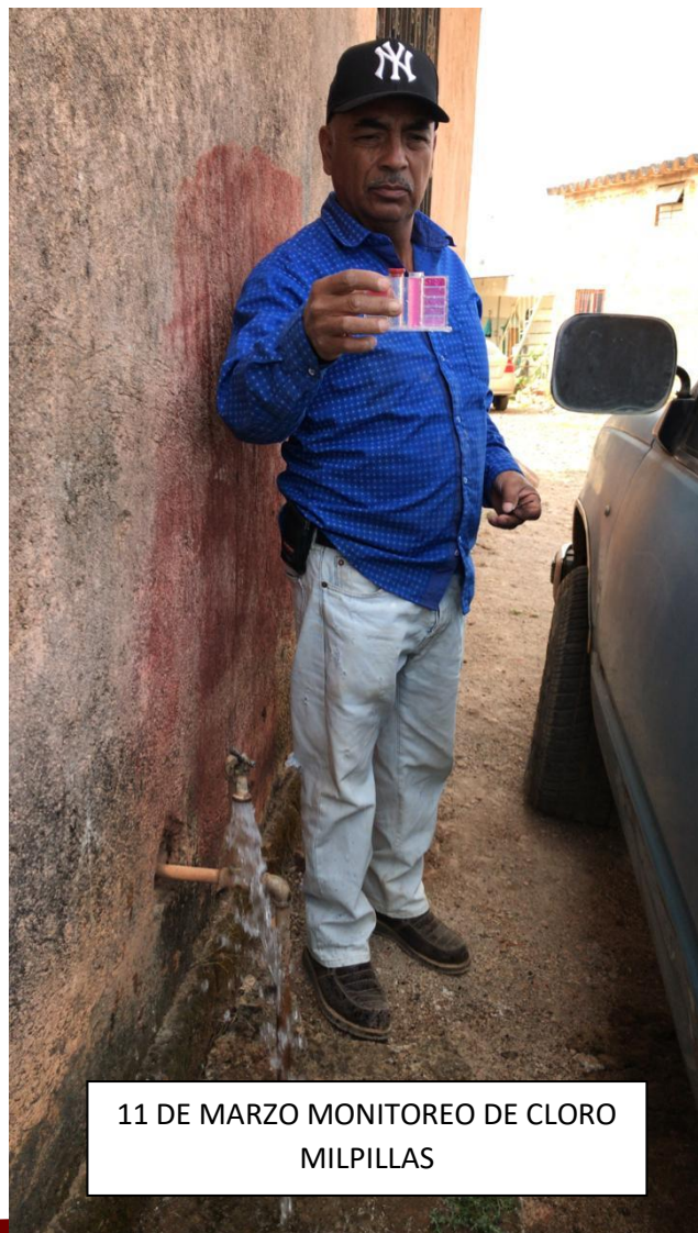
11 DE MARZO MONITOREO DE CLORO MILPILLAS