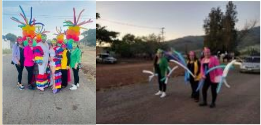
Me traslade a la localidad de Milpillas Bajas perteneciente al municipio, a fin de participar en el “Rompimiento de Fiestas Ejidales 2024” .