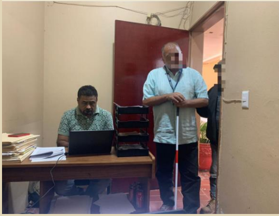
Recibí y atendí al señor Julio de aquí la cabecera municipal.