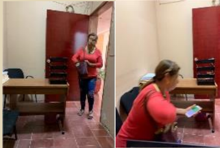
Se recibió y atendió a la señora Angelica de aquí la cabecera municipal, se le oriento en torno a su problema.