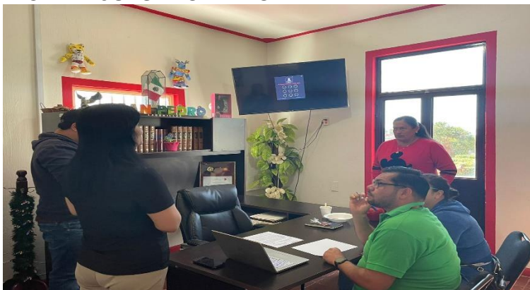
LIC. DEL JUZGADO MIXTO.