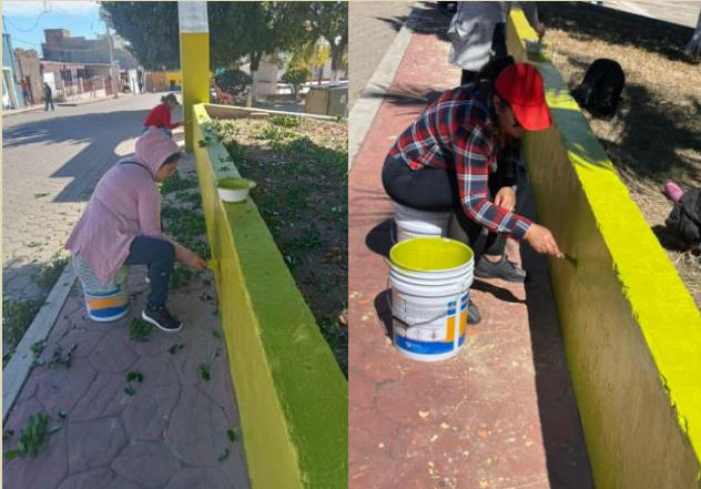
Se participo en la pinta de la plaza pública en la localidad de Amado Nervo, los días 27 y 28 de diciembre del 2023.