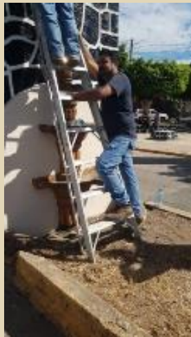
Se apoyó a servicios públicos con la pintada de los arcos.