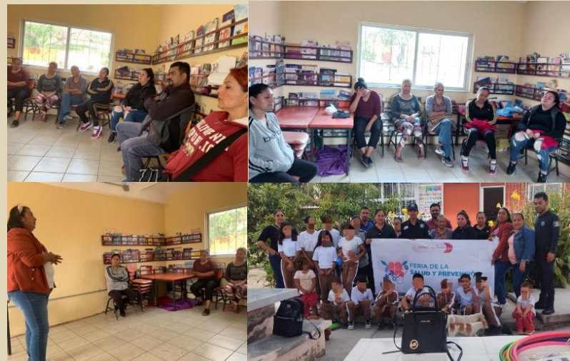
Se acudió a las instalaciones de la escuela primaria “ Hermanos Flores Magón ” de la localidad de Cerro Pelón perteneciente al municipio, a fin de llevar a cabo la “ FERIA DE LA SALUD Y PREVENCIÓN CONTRA LA VIOLENCIA ”, actividades dirigidas a 13 alumnos, 6 padres de familia y 1 docente, en la cual nos tocó impartir el taller denominado Prevención de Adolescentes en Riesgo , el cual fue bien recibido y con gran aceptación.