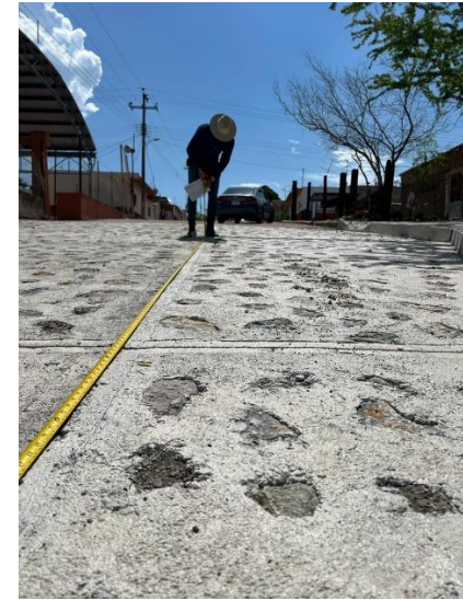
Supervisión de la obra “Construcción de empedrado ahogado y rehabilitación de servicios en calle Eucalipto [...] de Amado Nervo, municipio de San Pedro Lagunillas”