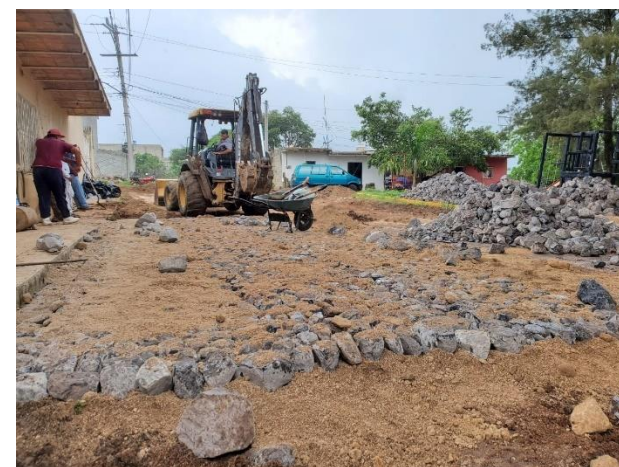
Reposición de empedrado en zanjas en calle Matamoros entre Altamirano y Leandro Valle en la cabecera municipal de San Pedro Lagunillas