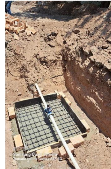
Supervisión de la obra “Construcción de empedrado ahogado en calle Corregidora [...] en la localidad de Cuastecomate, municipio de San Pedro Lagunillas”.