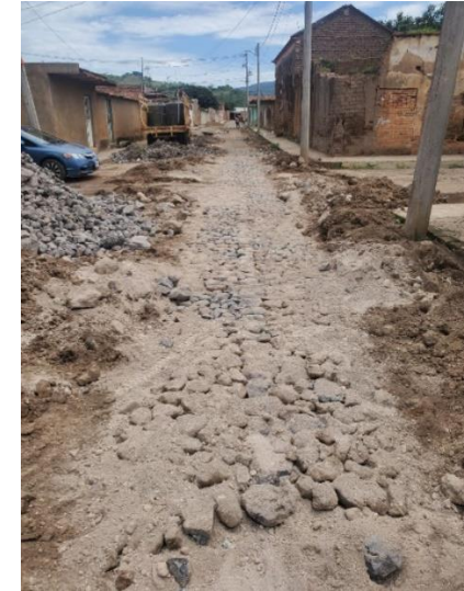
Supervisión de la “Construcción de empedrado ahogado en la [...] localidad de Cerro Pelón, municipio de San Pedro Lagunillas”.