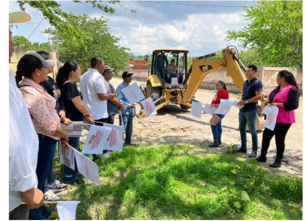
Trabajos en el interior y exterior del Centro Comunitario de Aprendizaje y la Salud en la cabecera municipal.