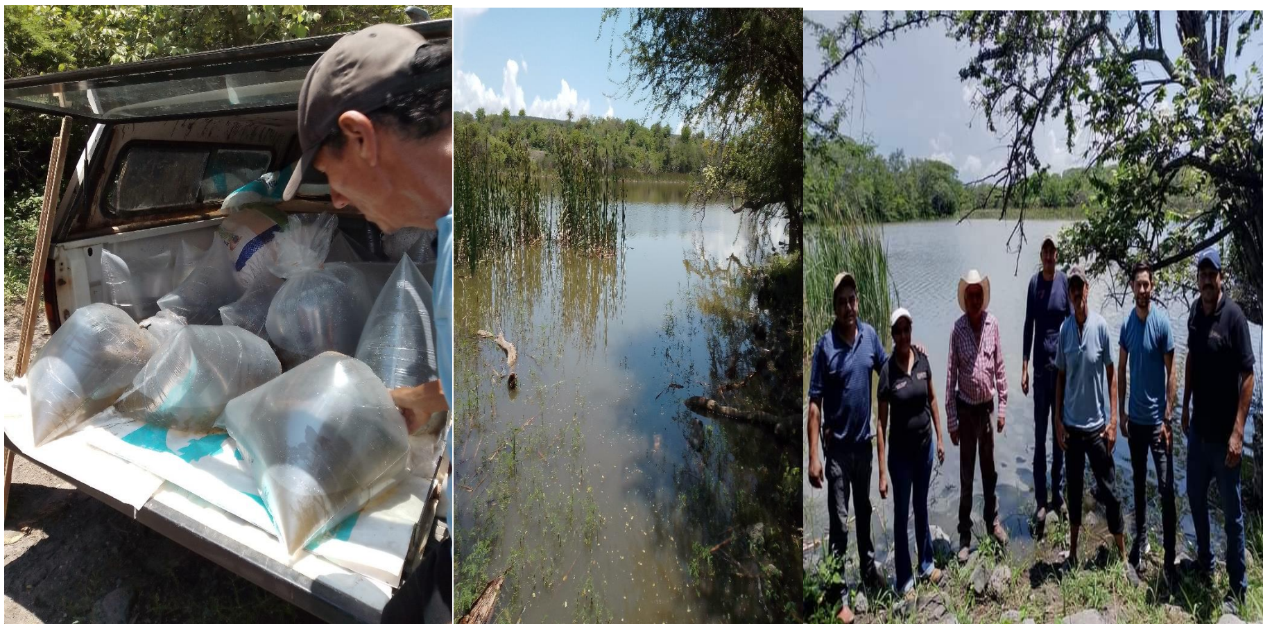
SIEMBRA DE 40,000 ALEVINES EN LAPRESA DE LA SOLEDAD, EN AMADO NERVO "EL CONDE".