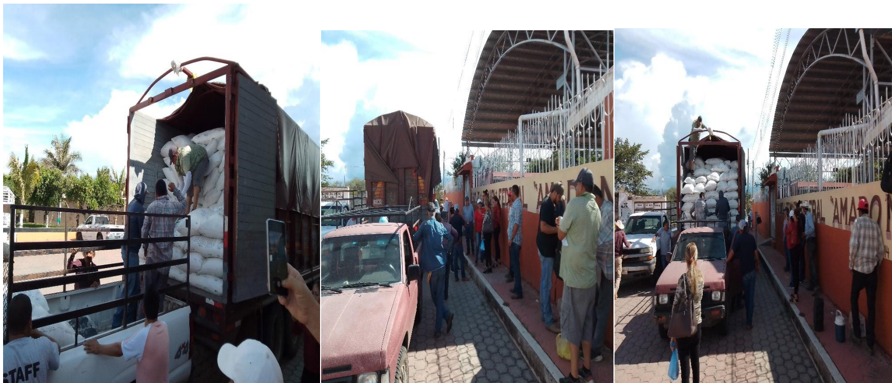
ENTREGA DE FERTILIZANTE A BAJO COSTO EN AMADO NERVO , A PRODUCTORES DE LA PARTE BAJA DEL MUNICIPIO.