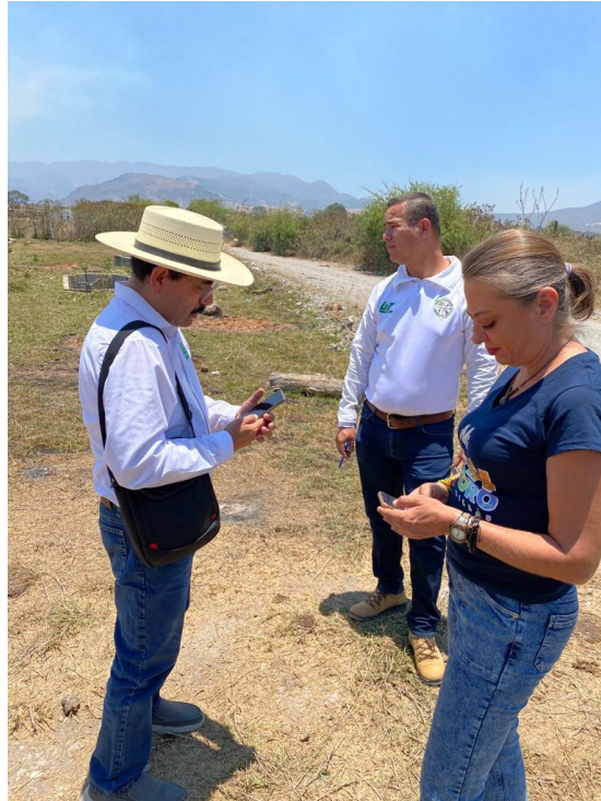
REUNION CON PERSONAS DE LA UT DE NAYARIT PARA CONTESTAR CUESTIONARIO SOBRE DE LAS LAGUNAS DE OXIDACION