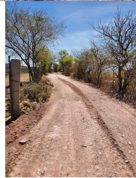
Reparación y mantto. De las maquinas del Ayuntamiento