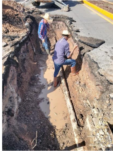
Trabajos de mejoramiento de caminos saca cosechas en las localidades de Cuastecomate, Tequilita y Amado Nervo con las maquinas del Ayto.