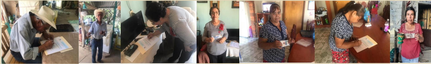
Nos trasladamos a las localidades de Amado Nervo, Cuastecomate y Tequilita, a fin de entregarles los premios en efectivo a las personas que resultaron ganadoras en el pasado concurso de manualidades de bolas de cuastecomate