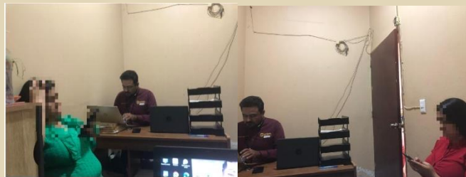
Se elaboro un convenio del asunto 2/2023 de Enedina de Cuatecomate.