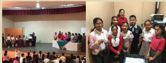
Recibí y atendí a los niños que participaron en la Toma de Protesta de la Niñez Gobernante 2023.