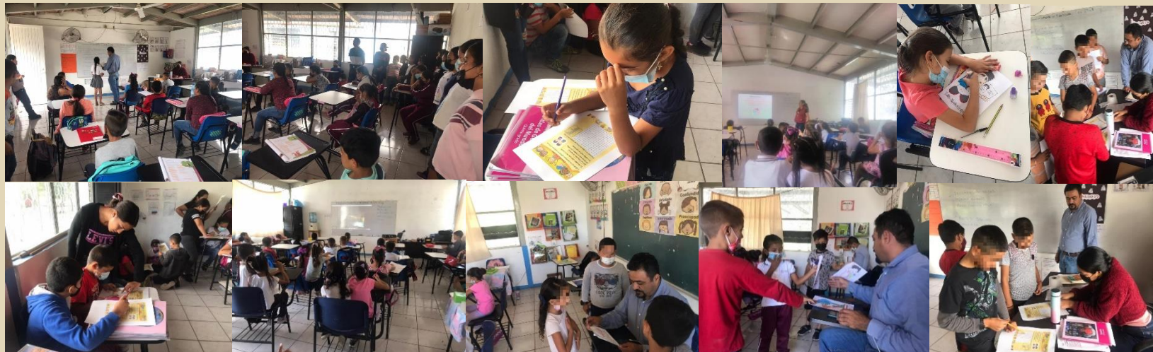
Platica informativa de Derechos Humanos en la escuela primaria " Miguel Hidalgo ", de la localidad de Cuastecomate, el 05 de octubre del 2022.