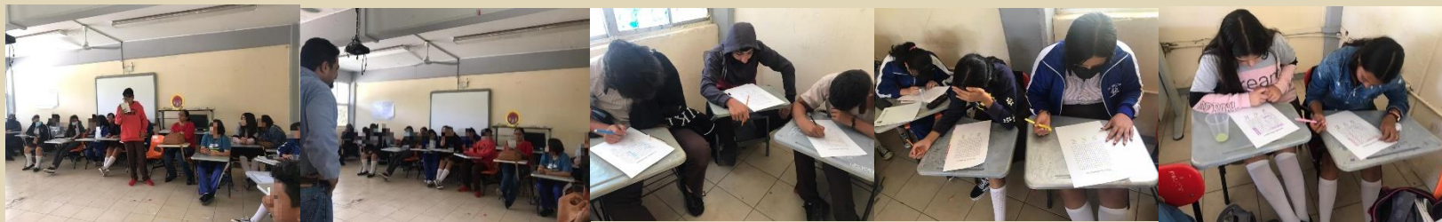
Platica informativa de Derechos Humanos en la escuela secundaria " Emiliano Zapata No. 45 ", de la localidad de Cuastecomate, el 05 de octubre del 2022.