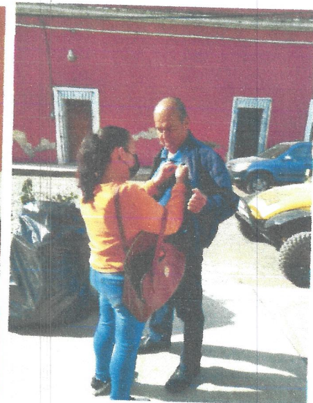
25 de Febrero del 2022