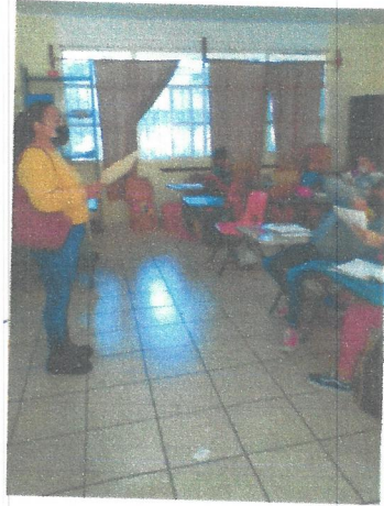
21 Al 25 de Febrero del 2022